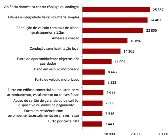
Figura 2 - Alguns crimes registados pelas autoridades policiais, em 2025

A figura 2 coloca em destaque algumas das categorias de crimes mais frequentes, entre os quais surge o crime de “violência doméstica contra cônjuges ou análogos” com 25.357 crimes e o crime de “Ofensa à integridade física voluntária simples” com 24.407 crimes 2 .